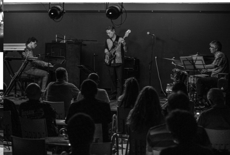
23 de setembre, Jazz Club la Vicentina, Sant Vicenç dels Horts: Instantània de l'actuació de Tarkology Jaume Vilaseca Trio a Jazz Club la Vicentina.