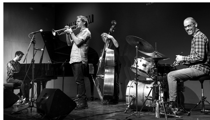
24 de setembre, Auditori Vinseum, Vilafranca del Penedès: Moment del pas del projecte Grebaliariak de Juan de Diego a l'Auditori Vinseum de Vilafranca del Penedès.