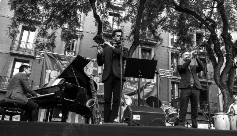
18 de setembre. Formació Pol Omedes ¡Pura Vida! al complet, sobre l'escenari de la Plaça de la Vila de Gràcia. Autor: Oliver Adell.