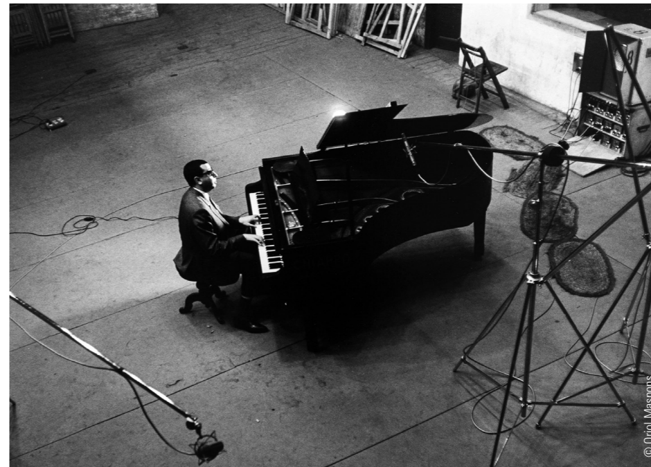
Tete Montoliu 1966. Museu Nacional de Catalunya.

Recuerdo que, caminando por la plaza que está frente al teatro Coliseo, mucha gente lo reconoció. Y como es común allá, se acercaron a expresarle su admiración. Tete no salía de su asombro. No entendía cómo su música había llegado a lugares tan lejanos.