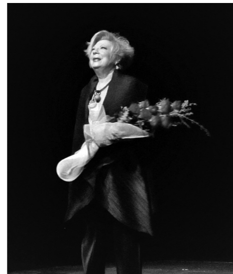
Núria Feliu a l'homenatge que li van retre a l'any 2011, just abans de la seva retirada dels escenaris.