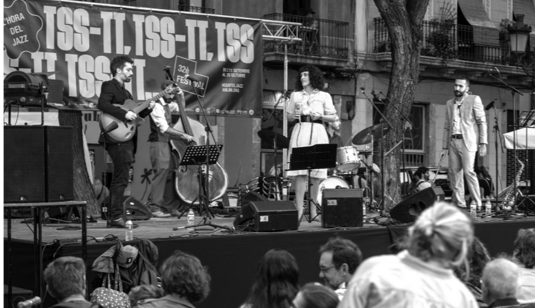
2 d'octubre. Instantània de l'actuació del Maria Esteban Quintet a la Plaça de la Vila de Gràcia.