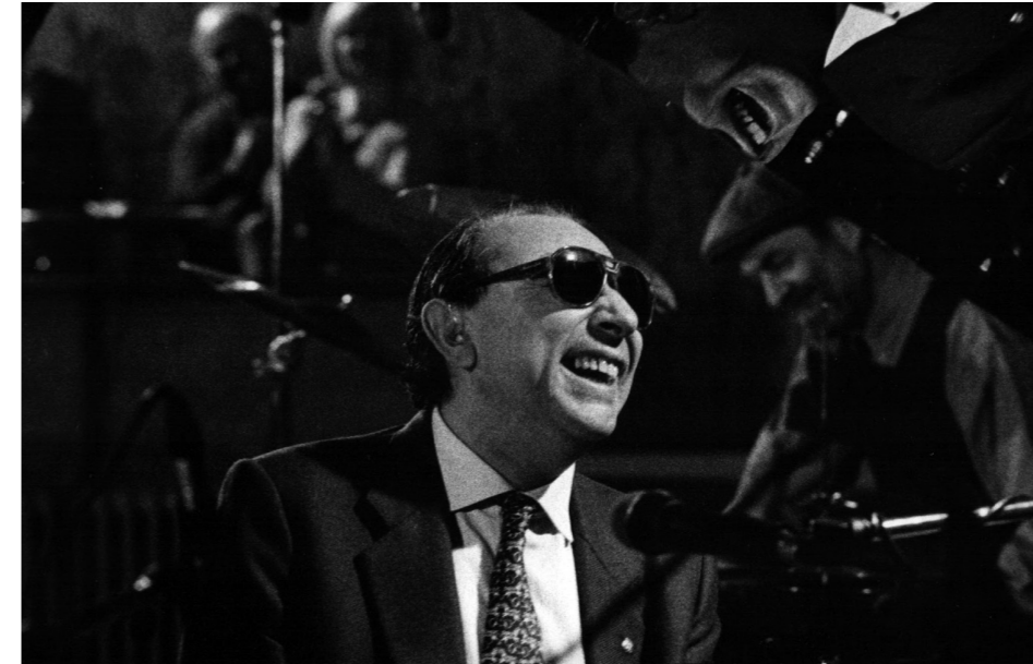
Tete a Figueres 1996.

La primera vez que oí hablar de Tete fue en Buenos Aires. Hacía poco que había llegado yo a la Big City y estaba estudiando contrabajo en el Conservatorio Municipal.