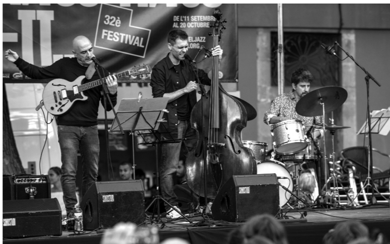
2 d'octubre. Actuació del Madera Viva Trio a la Plaça de la Vila de Gràcia. Autor: Oliver Adell.