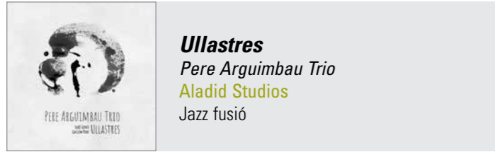
Ullastres Pere Arguimbau Trio Aladid Studios Jazz fusió

Pere Arguimbau , guitarra / Lluís Gener , contrabaix / Guillem Pons Taltavull , bateria