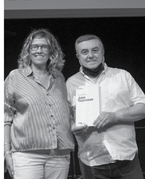
PREMI A L'IMPULS DE LA MÚSICA EN VIU Jazz Terrassa

Sempre és incert, amb la nostra feina. Estic en un moment on trobo a faltar espais de creació. Espero que arribin aviat i pugui treure música nova l'any que ve.